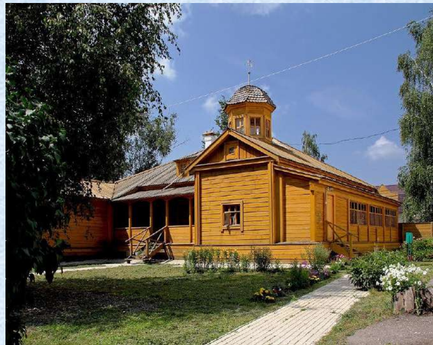
Дом – музей В.Г. Белинского