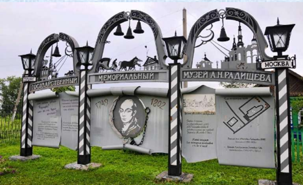
Музей А.Н. Радищева