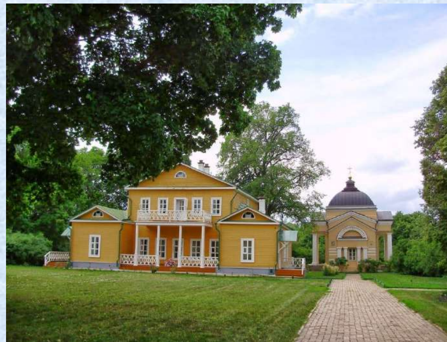
Музей – заповедник «Тарханы»