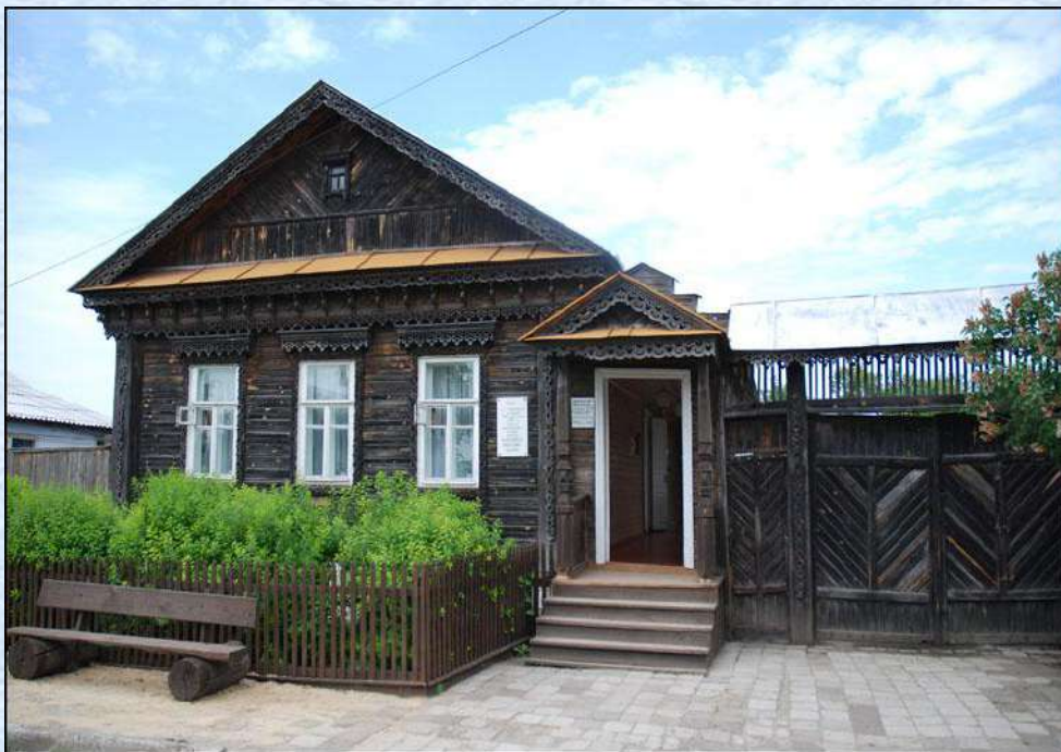
Дом – музей А.И. Куприна